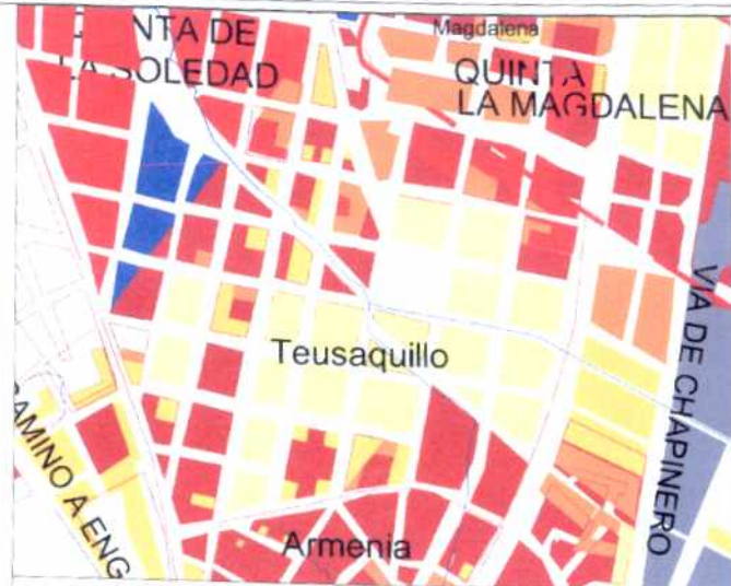
CRECIMIENTO HISTÓRICO - CRONOLOGÍA