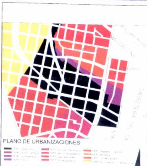
PLANO DE URBANIZACIONES

Las calles amplias y arborizadas, muestran una predialización definida pero flexible que abrió la posibilidad de construcciones con antejardines y aislamientos laterales. Esta posibilidad predial configuro una espacialidad urbana de características únicas dentro de Bogotá.