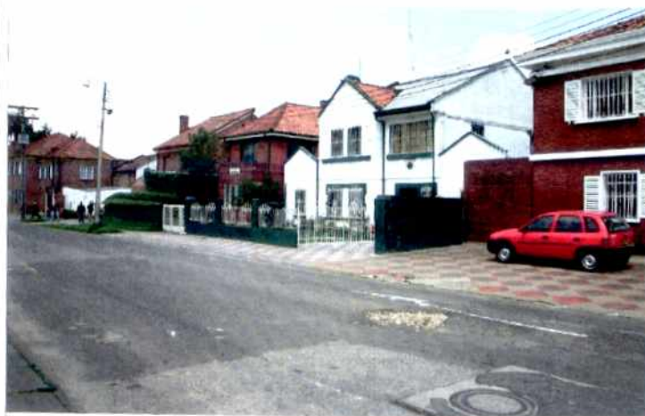
CRITERIOS DE CALIFICACION